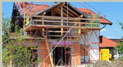
EDILIZIA E COSTRUZIONE