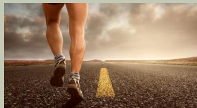
SPORT E TEMPO LIBERO