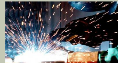
MECCANICA E MECCATRONICA