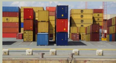
LOGISTICA E TRASPORTI