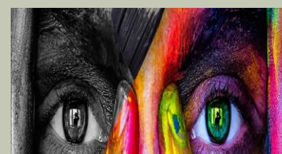
GRAFICA E DESIGN