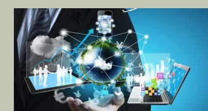
INFORMATICA E TELECOMUNICAZIONI