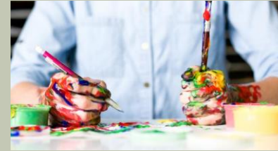
ARTE E SPETTACOLO