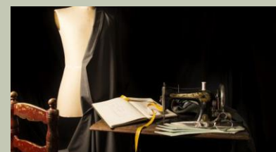
MODA, PELLETERIA, TESSILE