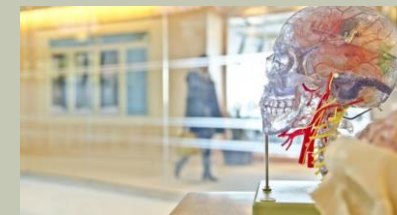
SANITARIO E SOCIALE