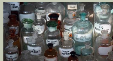
CHIMICA E FARMACEUTICA